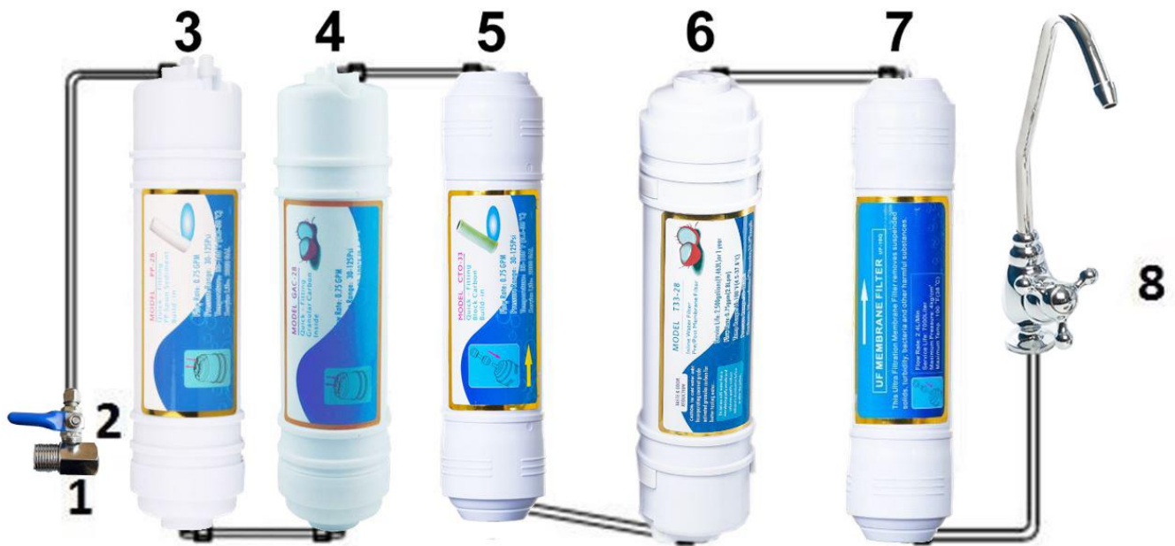
1. Trejgabals ventilim, 2. Ūdens pievada ventilis, 3. Mehāniskais filtrs, 4. Aktīvās ogles filtrs, 5. Jonu sveķu filtrs, 6. II. pakāpes ogles filtrs, 7. UF Membrāna, 8. Krāns